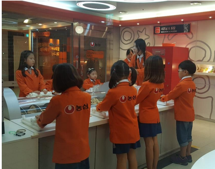
직업체험(키자니아, 잠월드 등)