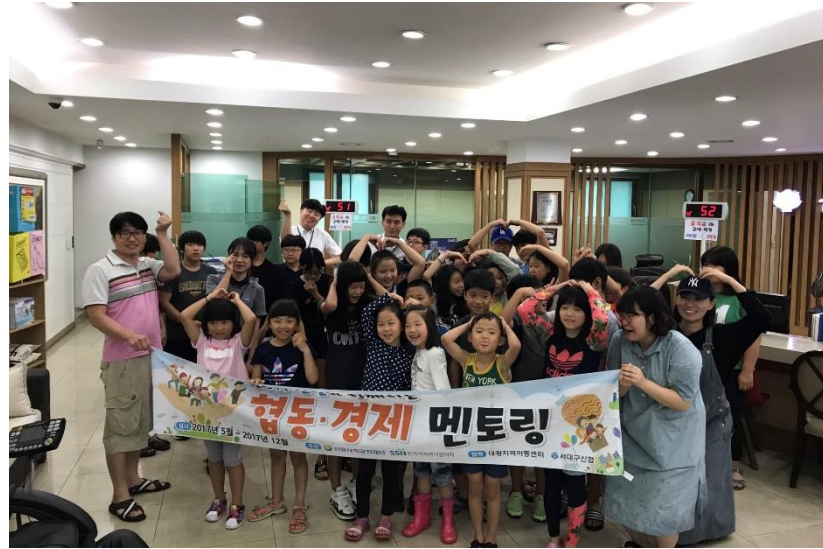
매칭 실험 견학