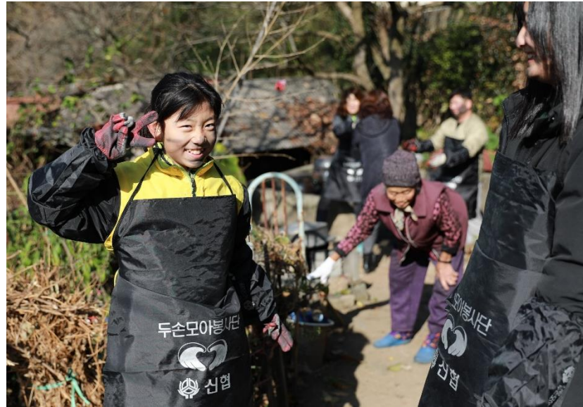
멘토-멘티 동반 봉사활동